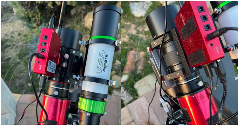
Exemple de montage objectif 135 camera 2600 zwo asiair et guidage avec caméra non visible sur la photo